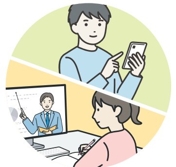
オンライン学科教習 配信中! 技能教習の予約は インターネットで!