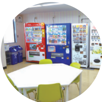
飲食OK! ゆっくり できる1F休憩室