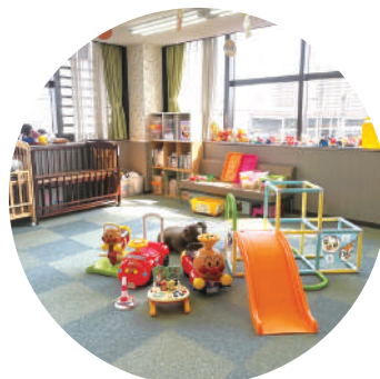
パパもママも安心! 3F無料託児室