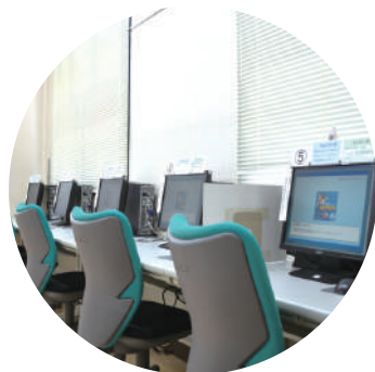
2F学科試験 学習コーナー